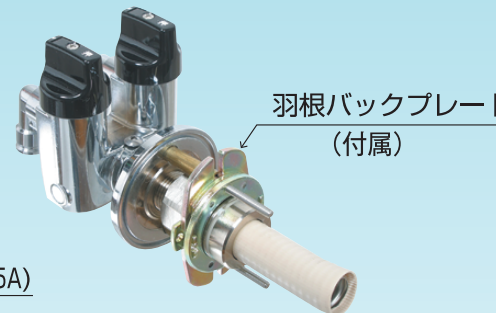
■ GPL-4FOCCFFP・Rc \frac{1}{2}